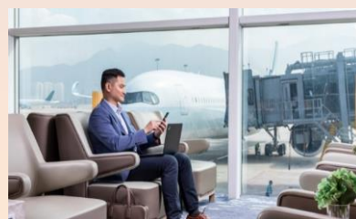
香港環亞機場貴賓室免費體驗