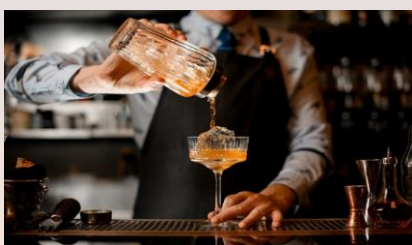
兩杯免費迎賓飲品

參觀香港貿易發展局在四月假香港會議展覽中心舉行的五項時尚生活產品匯（「香港禮品及贈品展」，「香港時尚家品展」，「香港國際家用紡織品展」，「香港時裝節」和「香港國際印刷及包裝展」），從一系列專屬體驗中選擇一項禮遇：