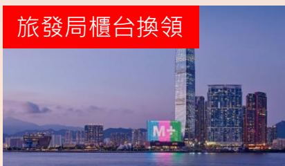
免費M+博物館一天入場門票